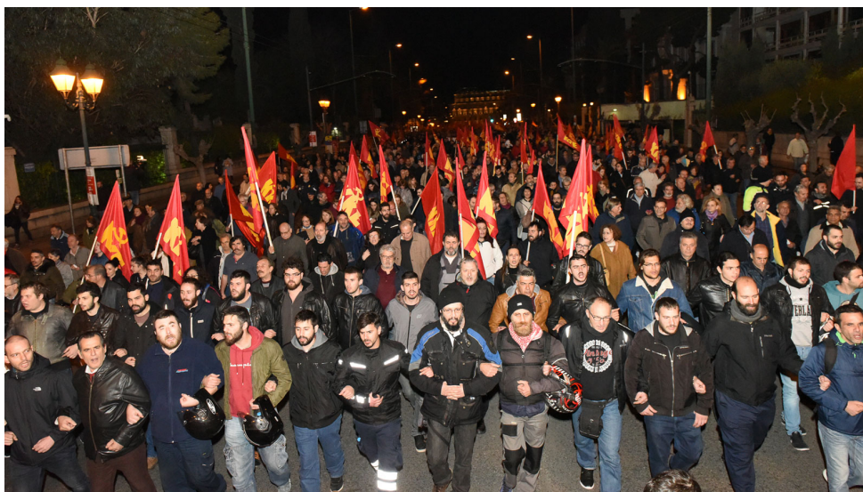
Manifestazione del PC di Grecia (KKE), Atene, 27 febbraio 2018

Di fronte a questa escalation, i comunisti greci e turchi stanno combattendo insieme contro la possibilità di una guerra fratricida, la propaganda imperialista, il nazionalismo e il