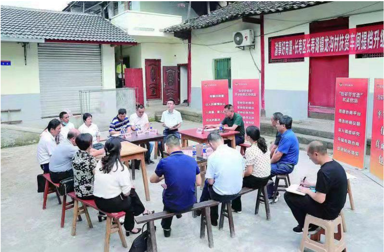
25 giugno 2021, CCPPC Distretto di Changshou, Chongqing L'attività di consultazione di base "I problemi di Chongqing sono facili da discutere" è entrata nel villaggio di Longgou, città del lago di Changshou.