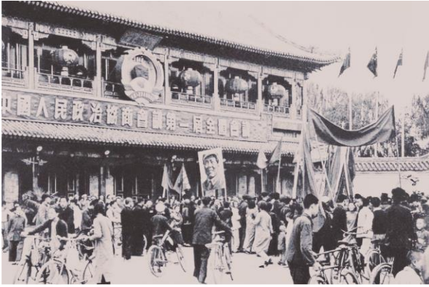
Prima Sessione Plenaria della Conferenza Consultiva Politica del Popolo Cinese

Durante la Rivoluzione di Nuova Democrazia, il PCC ha guidato il popolo nella sua tenace lotta per la democrazia, resistendo all'oppressione e allo sfruttamento nel corso della sua lotta. Alla fine, la vittoria è stata assicurata nella rivoluzione.