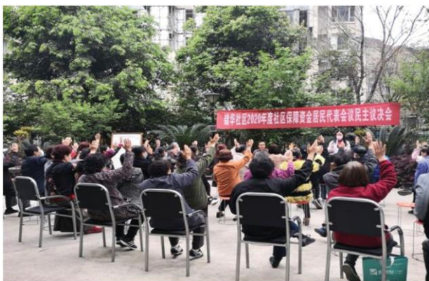
Rappresentanti della Comunità dei Residenti