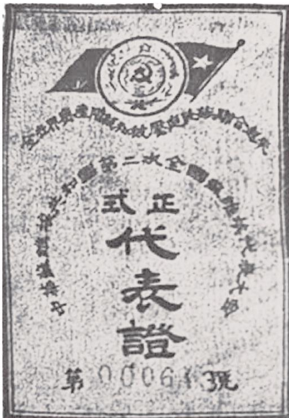
Documento di riconoscimento ufficiale del Secondo Congresso Nazionale del Soviet cinese

Durante la Guerra Rivoluzionaria Contadina, lo Schema di Costituzione della Repubblica Sovietica Cinese adottato dal Primo Congresso Nazionale del Soviet Cinese 2 nel 1931 stabiliva che il regime sovietico cinese fosse governato da una dittatura democratica di operai e contadini e che l'intero regime sovietico appartenesse ai lavoratori, ai contadini, ai soldati dell'Armata Rossa e a tutte le persone laboriose. La Repubblica Sovietica Cinese è stato il primo regime democratico nazionale di lavoratori e contadini nella storia cinese. Dal novembre 1931 al gennaio 1934, nella base rivoluzionaria centrale si sono svolte tre elezioni democratiche, con oltre l'80% degli elettori che hanno partecipato alle elezioni in molti luoghi. Anche altre basi rivoluzionarie istituirono congressi di operai, contadini e soldati ed elessero governi sovietici a tutti i livelli.