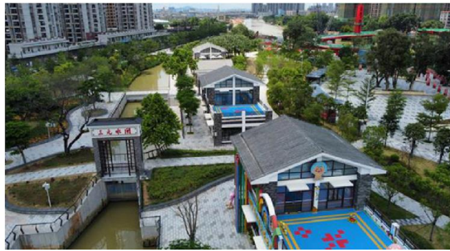
Una baraccopoli, trasformata in un bellissimo parco, nella città di Jiangmen, provincia di Guangdong

La vita ecologica e a basse emissioni di carbonio è diventata una nuova moda. I cinesi guidano il 50% dei veicoli a nuova energia del mondo sulla più grande rete di superstrade del mondo. Entro il 2025, il popolo cinese otterrà risultati notevoli nel passaggio a un lavoro e a uno stile di vita ecocompatibili. L'energia e le risorse saranno allocate in modo più razionale e utilizzate in modo molto più efficiente. Il consumo di energia per unità di PIL e le emissioni di anidride carbonica per unità di PIL saranno ridotti rispettivamente del 13,5% e del 18%. Lo scarico totale dei principali inquinanti sarà costantemente ridotto. La copertura forestale raggiungerà il 24,1% e l'ambiente sarà costantemente migliorato con una difesa più forte della sicurezza ecologica. Anche l'ambiente di vita nelle aree urbane e rurali sarà notevolmente migliorato. Entro il 2035, il lavoro e lo stile di vita ecologici saranno ampiamente avanzati. Le emissioni di anidride carbonica diminuiranno costantemente dopo aver raggiunto un picco, e ci sarà un miglioramento fondamentale dell'ambiente ecologico dopo aver raggiunto l'obiettivo di costruire una Cina Bella.