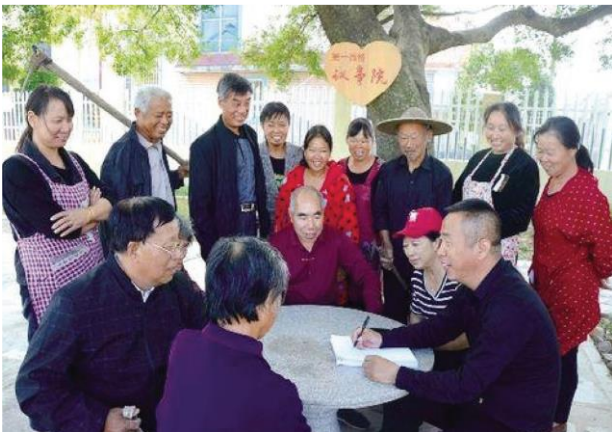
Consiglio di Villaggio

Hanno disposto che i rappresentanti dei comitati di partito, i deputati alle assemblee del popolo e i membri del CCPPC visitino le comunità rurali e urbane. Tutte queste forme concrete e pragmatiche di democrazia incoraggiano le persone a esprimere le proprie opinioni e suggerimenti e condurre ampie consultazioni su questioni relative ai loro interessi vitali. Ciò aiuta a coordinare gli interessi di più parti interessate, mitigare i conflitti e mantenere la stabilità sociale e l'armonia a livello di base. Molte esperienze e pratiche di base di successo si sono infine trasformate in politiche nazionali, iniettando nuova vitalità nello sviluppo della democrazia cinese.