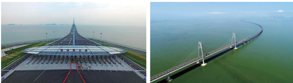
Il ponte Hong Kong-Zhuhai-Macao

Verrà sviluppata la sinergia tra le imprese, le università e gli istituti di ricerca del Guangdong, di Hong Kong e di Macao, verrà promosso l'impegno per la costruzione di un Centro scientifico nazionale completo e verrà facilitato il flusso transfrontaliero dei fattori di innovazione. Le risorse del trasporto marittimo e dell'aviazione saranno meglio allocate grazie alla costruzione di più linee ferroviarie interurbane e al miglioramento del layout funzionale di porti e aeroporti. Per i giovani di Hong Kong e Macao sarà più facile e pratico studiare, trovare lavoro e avviare imprese nelle città continentali della Greater Bay Area.