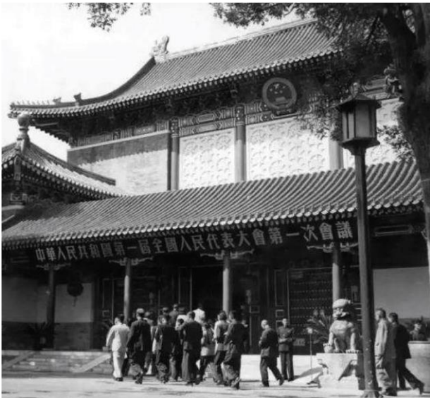
Prima Sessione della Prima Assemblea Nazionale del Popolo

Il processo di stesura della Costituzione nel 1954 rifletteva pienamente la democrazia e l'opinione pubblica. Mao Zedong ha detto: "Perché questa bozza di Costituzione gode del sostegno popolare? Penso che uno dei motivi sia che la Costituzione è stata redatta sulla base delle opinioni dei principali organi statali e del popolo. La bozza di Costituzione, che unisce le opinioni di pochi leader con quelle di oltre 8.000 persone, sarà discussa dal popolo in tutto il Paese dopo la sua pubblicazione in modo che le opinioni delle autorità centrali e quelle del popolo siano entrambe prese in considerazione" 11 . "I principi della democrazia popolare attraversano l'intera Costituzione" 12 . La Costituzione della RPC, la legge fondamentale del Paese adottata alla Prima Sessione del Primo Congresso Nazionale del Popolo (ANP) nel settembre 1954, definiva chiaramente la natura della nuova Cina: "La RPC è una democrazia popolare guidata dalla classe operaia e basato su un'alleanza di operai e contadini. Questa è la prima costituzione socialista della RPC.