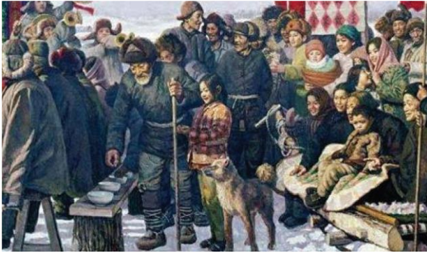
Dipinto ad olio "I Signori della Terra – Il Voto dei Fagioli"

gettare il fagiolo? Questa è la prima volta in settant'anni". Per quanto riguarda la democrazia praticata dal PCC durante la guerra di resistenza contro l'aggressione giapponese, Xu Teli ha concluso: "La nostra democrazia non ha precedenti nella storia, un'unità di democrazia e centralismo ad alti livelli" 3 . Nel 1944, Mao Zedong, allora Presidente dell'Ufficio Politico e del Segretariato del Comitato Centrale del PCC, affermò un pensiero profondo che "la democrazia deve essere praticata in tutti gli aspetti. Affari politici, militari, economici, culturali e di partito... tutti richiedono democrazia. Non c'è dubbio che tutti debbano e debbano essere unificati, ma l'unificazione dovrebbe essere basata sulla democrazia" 4 .