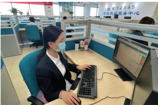
30 novembre 2021, il Centro servizi hotline per i cittadini di Pechino e l'agente di rete hotline 12345 stavano ascoltando e gestendo problemi segnalati dai cittadini attraverso WeChat, Weibo e altri canali di rete

Molte altre regioni hanno compiuto nuove indagini nella valutazione democratica dei funzionari. Dal 2019, la contea di Jingning, nella provincia sud-occidentale dello Zhejiang, ha esplorato modi per coinvolgere più persone nella valutazione delle prestazioni dei funzionari a livello comunitario. Attraverso un campionamento casuale e in base all'area di specializzazione e alla volontà personale, la contea seleziona più di 100 delegati al congresso del partito, deputati ai congressi del popolo e membri dei comitati del CCPPC, nonché rappresentanti dei funzionari del villaggio e di tutti i settori della società. Devono prestare attenzione a ciò che i dipartimenti e i funzionari del partito e del governo fanno in tutti gli aspetti durante l'anno. Sono inoltre invitati a partecipare alle conferenze di valutazione di fine anno a livello di contea, formando un enorme gruppo di giudici insieme ai principali funzionari della contea a livello di vice divisione o superiore, ascoltando i rapporti consegnati in pubblico dai funzionari delle squadre e commentando e segnare la prestazione degli arbitri. La conferenza di valutazione viene trasmessa in diretta al pubblico dell'intera contea su televisione, Internet e altri media a tempo debito. I pareri dei giudici costituirà un riferimento importante per la valutazione di fine anno dei funzionari interessati e una base importante per l'adeguamento dei posti dei funzionari nel prossimo anno.