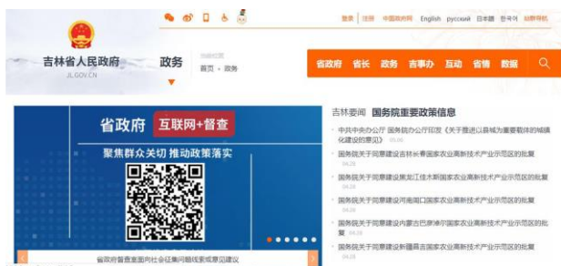
La homepage del governo popolare della provincia di Jilin

Mentre guidava il popolo nella creazione di un'ampia rete di supervisione popolare, il Partito ha cercato di guidare la supervisione pubblica con la supervisione interna e salvaguardare i risultati nello sviluppo della democrazia combinando la supervisione interna con la supervisione pubblica. Il PCC ha adottato misure per rafforzare i suoi regolamenti e richiedere a tutti i suoi membri e organizzazioni di agire nell'ambito della disciplina e delle regole del Partito. È stata introdotta la durata del mandato dei funzionari per le posizioni dirigenziali. La gestione dei funzionari, in particolare dei funzionari di alto rango, è stata rafforzata, con regole rigorose e chiaramente definite sui loro redditi e diritti per impedire l'evoluzione di un'élite privilegiata. Il Partito, il governo, la magistratura e tutti i settori sono diventati più trasparenti nella gestione degli affari; i principali organi del partito e dello Stato e il loro personale operano entro i limiti statutari, con poteri e responsabilità chiari e seguendo le procedure statutarie. Tutto ciò impedisce la ricerca di rendite e garantisce che l'esercizio del potere non si allontani oltre i propri confini.