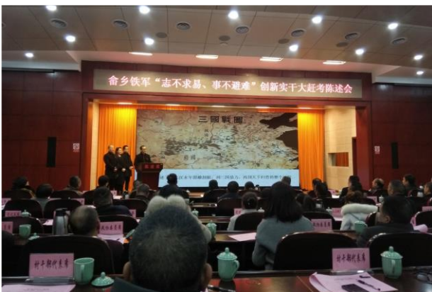
Presentazione del lavoro di fine anno per i quadri di livello primario nella contea di Jingning, provincia di Zhejiang, nel gennaio 2019

In secondo luogo, la pratica della democrazia popolare durante l'intero processo garantisce che il popolo possa veramente gestire il proprio paese secondo la legge.