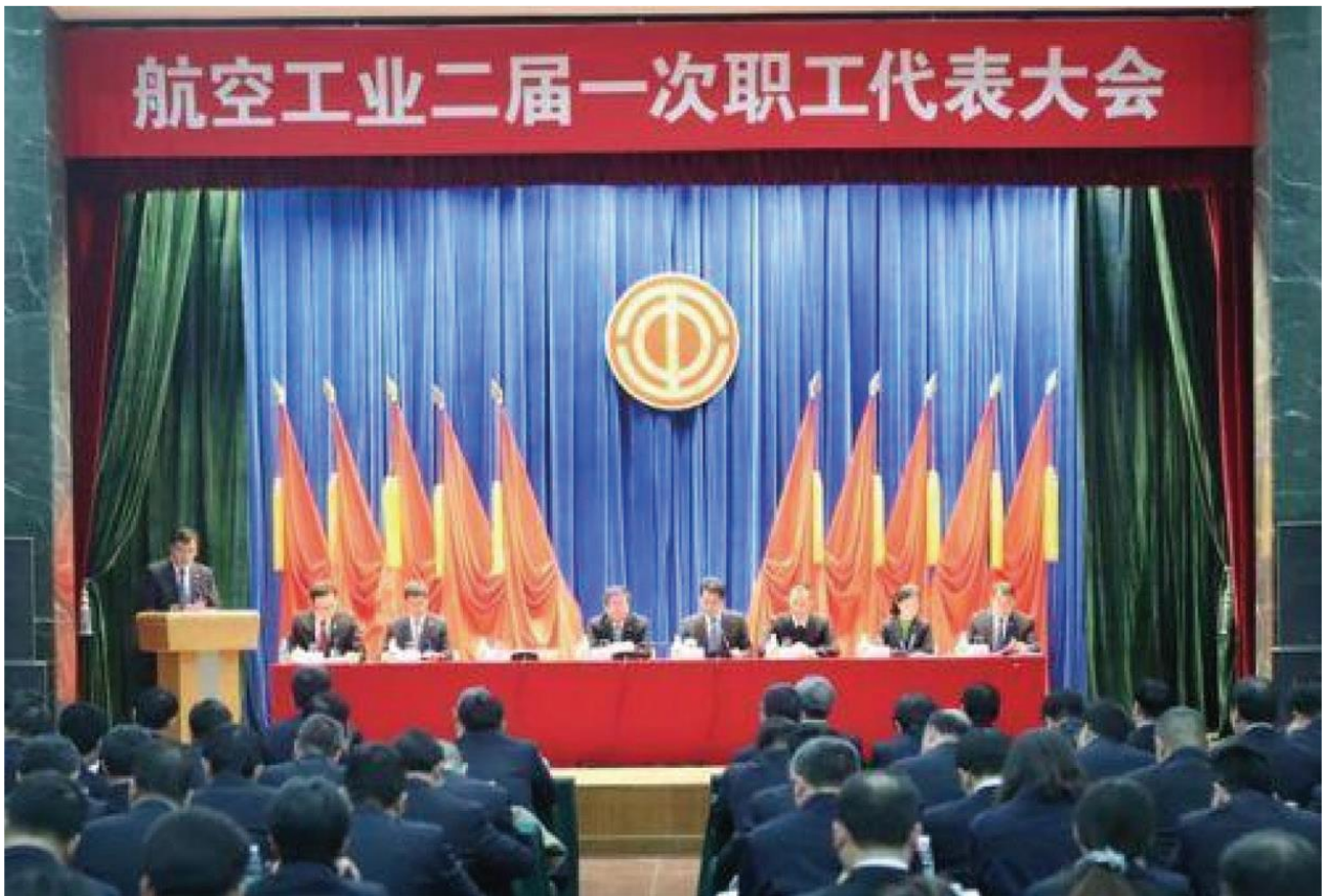
Seduta del Congresso degli Impiegati

Il sistema di autogoverno a livello di comunità ha rafforzato la capacità del pubblico di comprendere e praticare la democrazia, dimostrando che la democrazia cinese è ampia e genuina. L'autogoverno a livello comunitario dà energia a tutte le "cellule" della società. Rende la governance di base più vibrante ed efficiente e fornisce una solida garanzia istituzionale per un sistema di governance di base in cui le responsabilità sono condivise e debitamente adempiute e i risultati sono apprezzati da tutti.